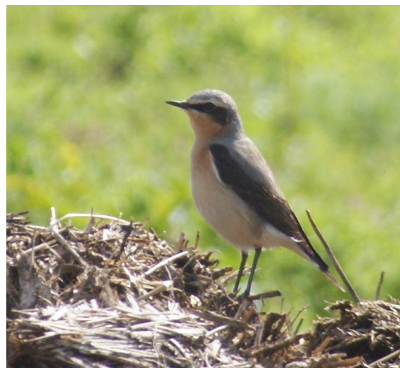
Traquet motteux, Bréteil le 01/05/2012

Traquet motteux : - 1 le 02/04 à Parigné (H. Berthelot). - 4 le 17/04 à Bruz (J. Garin). - 1 le 18/04 à L'Hermitage (J. Garin). - 1 le 28/04 au marais de Dol-de-Bretagne (P. Briand). - 1 le 28/04 à Saint-Méloir-des-Ondes (P. Briand).