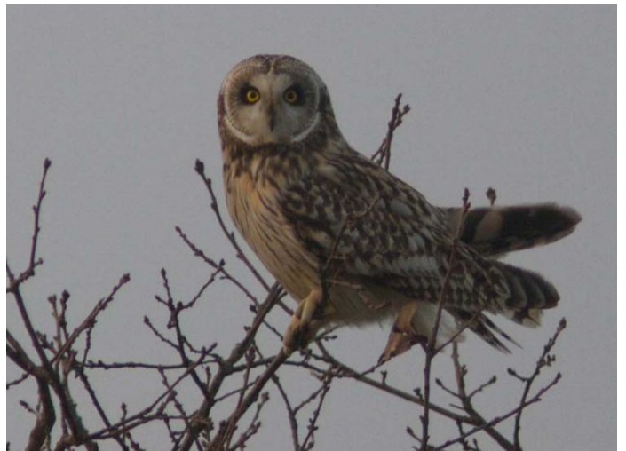
Hibou des marais, la Dominelais le 16/03/2012 (Photo : J. MÉROT).

- 3 chanteurs le 29/03 à Bédée (J. Garin).