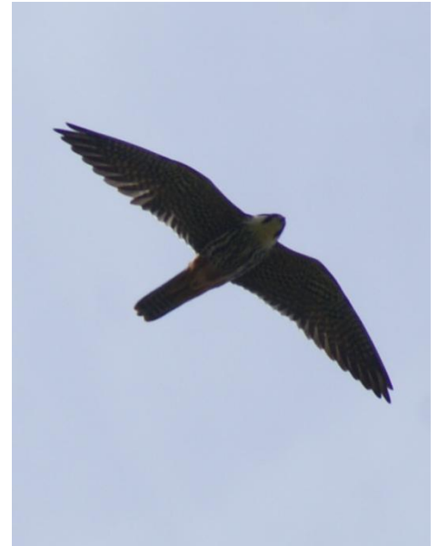
Faucon hobereau, Saint-Gilles le 27/04/2012

- 1 le 10/03 à l'étang du Boulet/Feins (R. Bourigault).